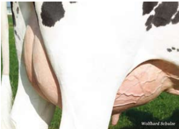
Belarus von Belantis - Euter - , Berliner Stadtgüter Nord KG, Gut Schönerlinde